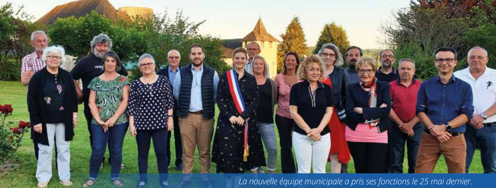
La nouvelle équipe municipale a pris ses fonctions le 25 mai dernier.